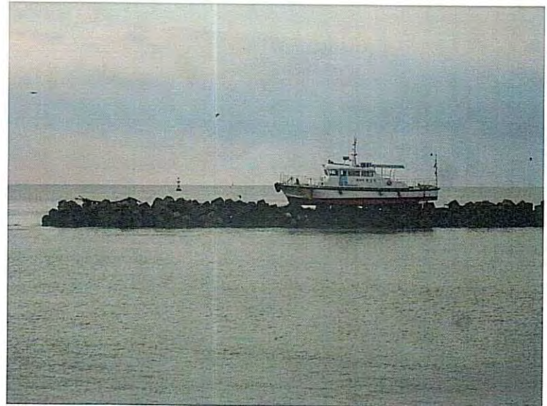
⑪ 乗り上げた船 その1 (波の威力を物語る1枚)