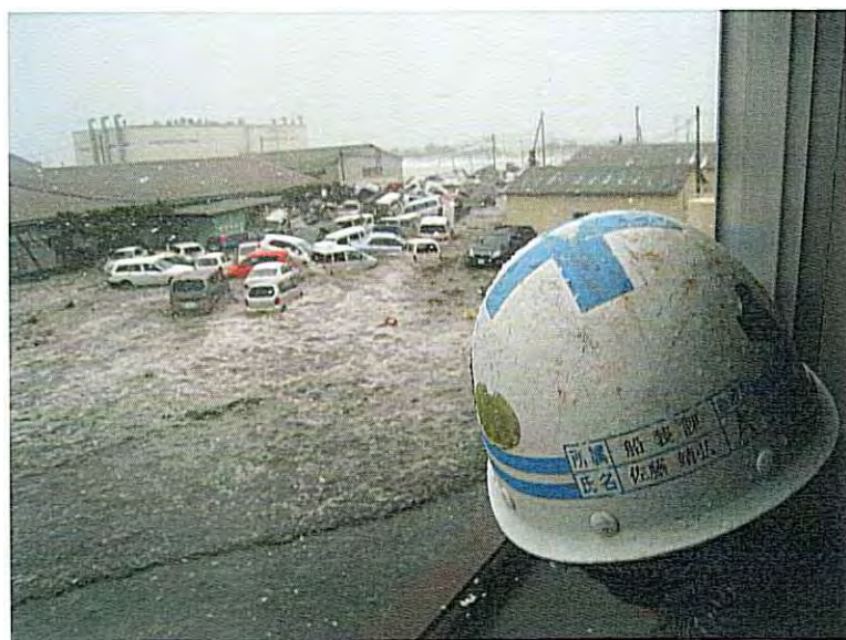
① 津波襲来直後 (津波によって流されてくる車両 その1)