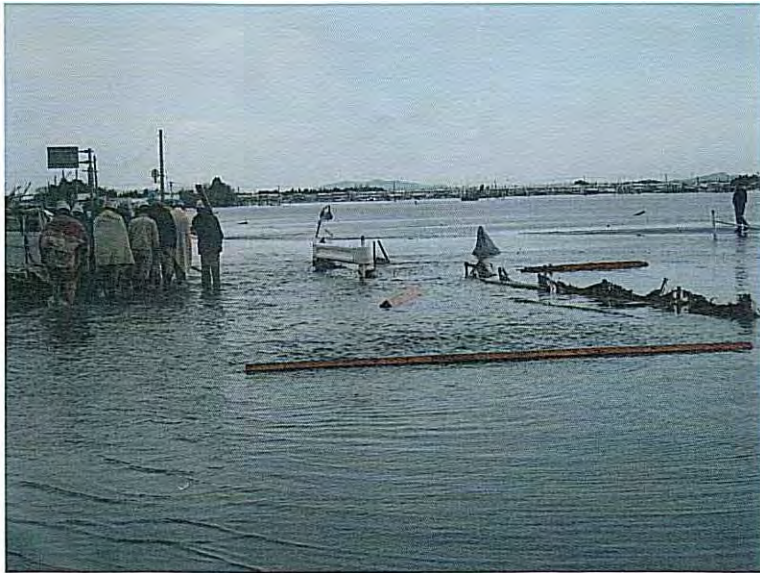
⑬ 避難経路 (あたり 1 而、悔か沼かといった状態)