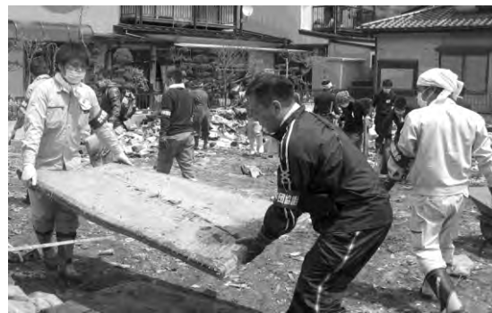
岸和田市青協のボランティア活動の様子

塚本 岸和田市青年団協議会 60 周年事業に向けて積み立てしとったんやけど、1 回目は、その積み立てを崩して交通費に当てた。それで若い子らみんな連れて行こうって。2 回目は会費 1 万円とって行った。市役所の人からカンパももらったりしてね。