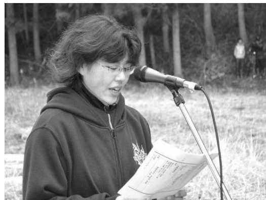
桜ライン 311 第2回植樹で司会をつとめる