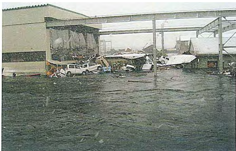
⑤ 津波艇来直後 (建物周辺が悔のように変化 その3)