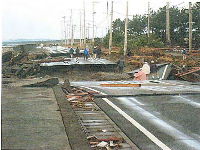
⑩ 迂路経路 (道格が大きく破坂されていた)