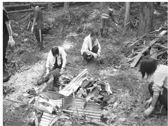
写真などを丁寧にひろっていく