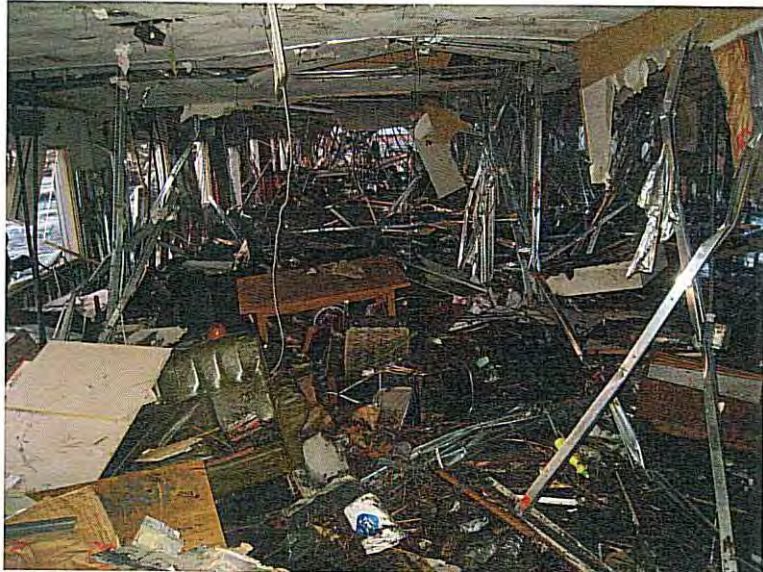
⑨ 避難した建物の1階 (一而瓦礫と破版された構造物)