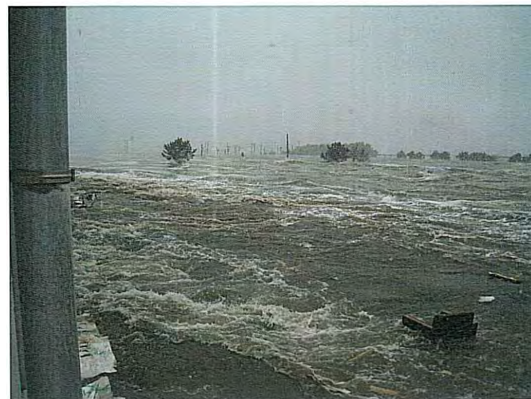
④ 津波襲来直後 (建物周辺が梅のように変化 その2)