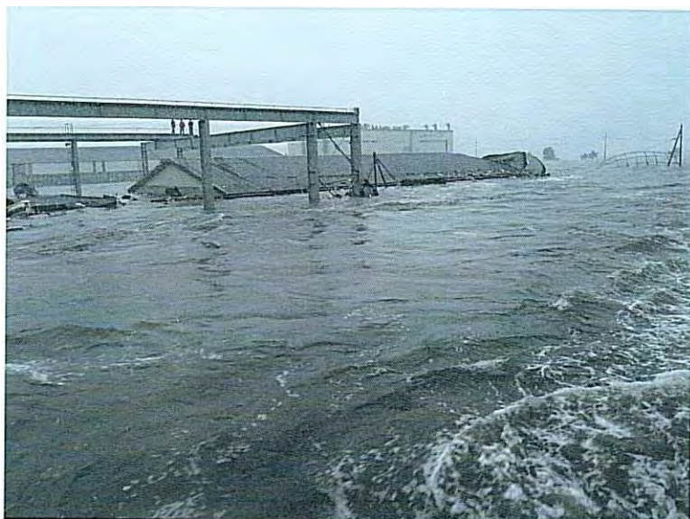
⑥ 油波腿来直後 (建物周辺が悔のように変化 その4)