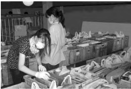
写真の整理をすすめていく

こうして、2日間が終了し、ほぼ初期段階の作業を終了させることができた。これからは、写真をデータベース化させる作業をより進めていくとのことである。道のりはまだまだ遠い。こうした、小さな一歩の積み重ねを、長い歳月をかけて続けていくことが重要であると実感することができた。