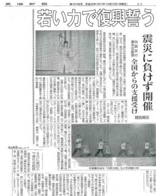
陸前高田市青協主催「青年芸能祭」掲載記事