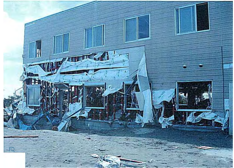
⑮ 私たちが避難した建物 その 1 (後日撮影)