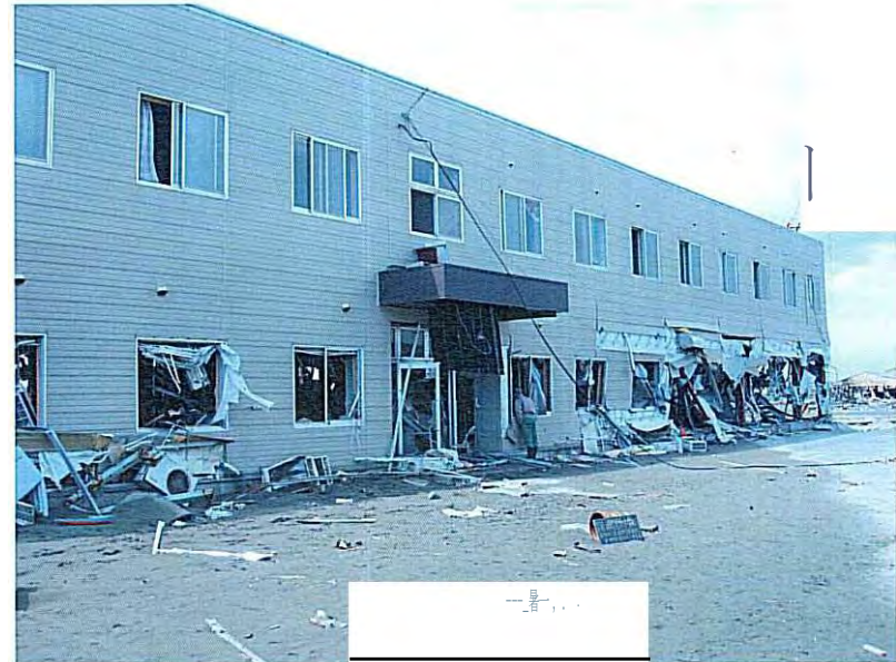
⑯ 私たちが避難した建物 その 2 (後日撮影)