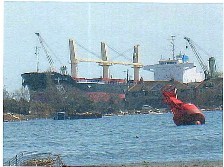
⑫ 乗り上げた船 その2 (建造中の大きな貨物船さえ簡に押し流す)