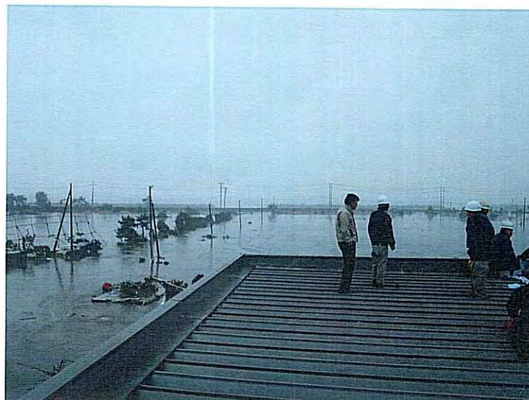
⑦ 建物屈根に避難した直後 (日没までi彫匠)