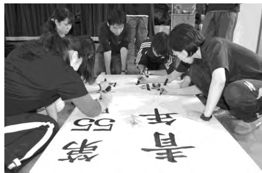
学生たちの共同作業