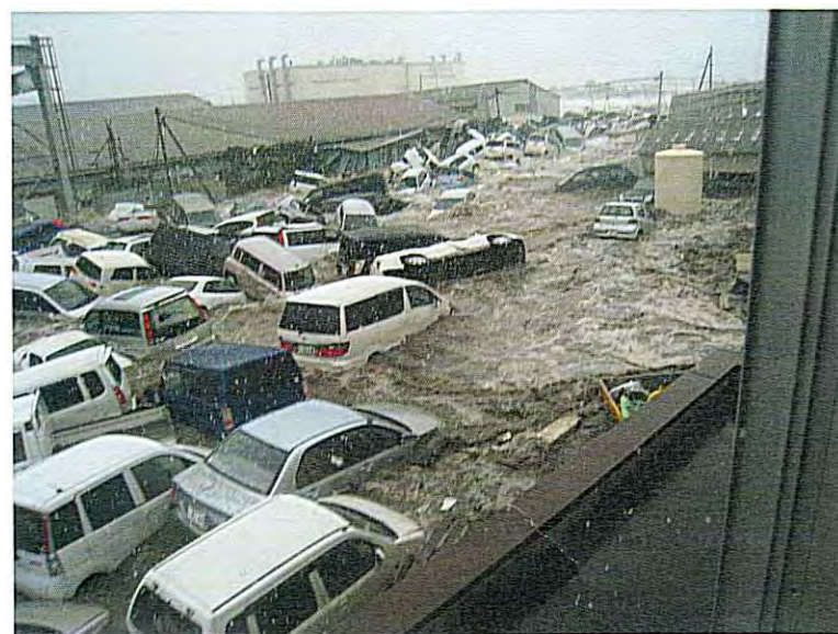
② 津波襲来直後 (沖波によって流されてくる車両 その2)