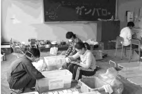
丁寧に洗浄作業をすすめていく