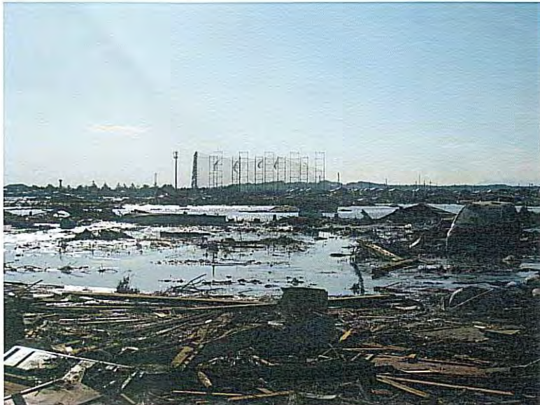
⑭ 瓦礫が散乱した風屈 (広大な水田も瓦礫だらけの状態)