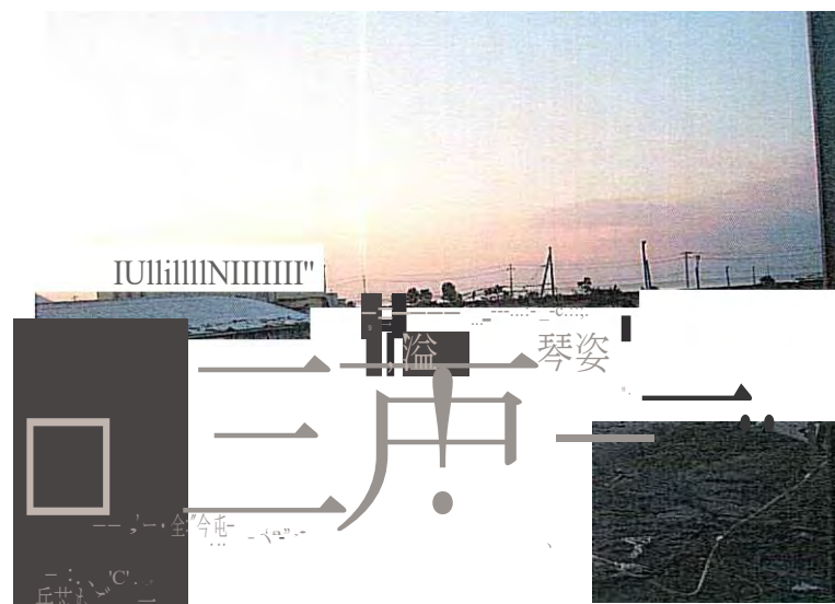
⑧ 12日 夜明け旺後 (水は引いたものの、あたり一而黒いへドロと瀧に股われていた)